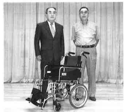
有限会社 太田技建様より車いすの寄贈