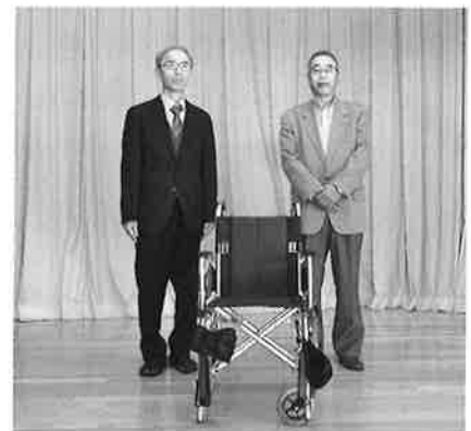
有限会社 太田技建様より車いすの寄贈

ご芳志、誠にありがとうございました。地域福祉の充実のため活用させていただきます。